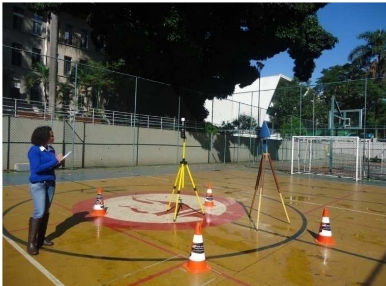
Figura 2 - Medição dos CEM's realizada na quadra principal.