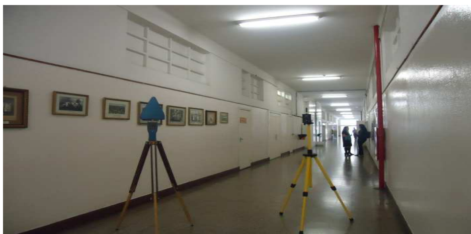
Figura 1 - Medição dos CEM's realizada no 2º andar do prédio 1.

A Figura 1 e a Figura 2 são amostras das medições, dentro do CUMIH.